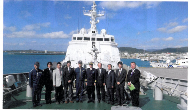
海上保安庁の視察 (写真は巡視船ではなくに)

全国的にみて、千葉県は、従前から規則や運用マニュアルで、かなり細かく活動費の使途やルールを定めていますが、今回の改正を受け、活動費の取扱いはさらに慎重になっていくと考えます。