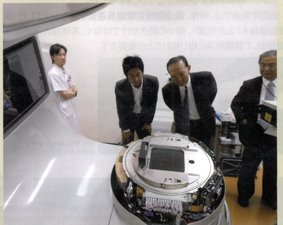
千葉県がんセンターの視察(写真は最新の放射線治療機器)

私たち議員ひとりひとりにおいても、今後の質問や提案の場面などにおいて、この条例を 最大限活用 していきます!!!